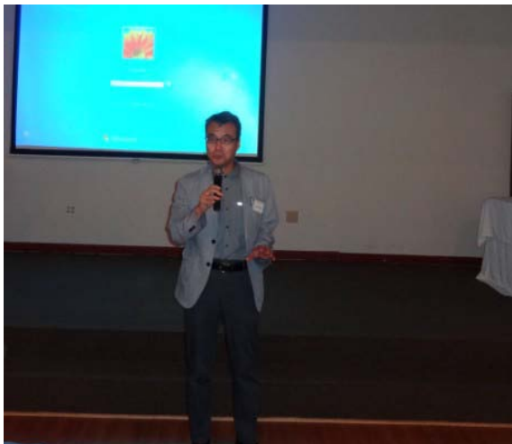
挨拶をする轟木所長 (INPEX)