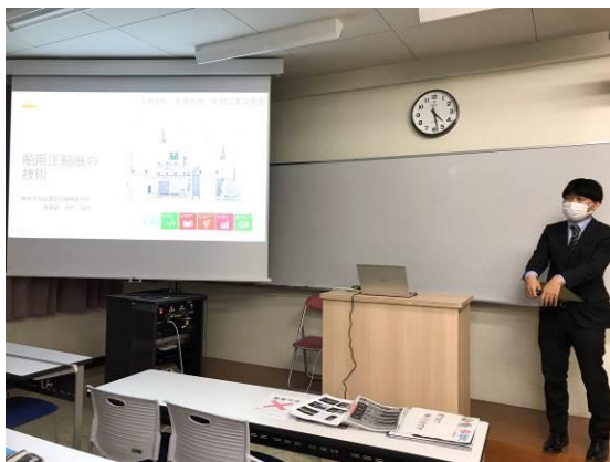
田邊空気機械製作所による講演