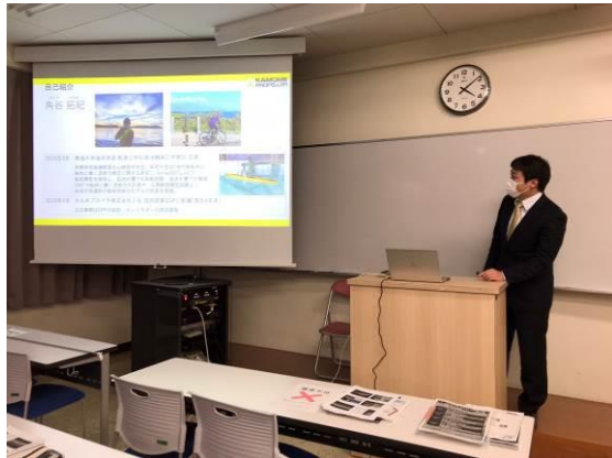
かもめプロペラによる講演