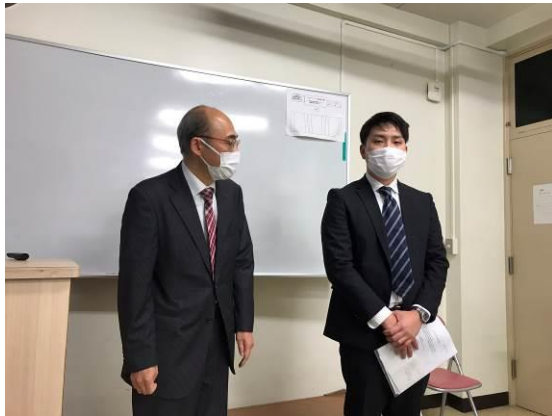
カシワテックによる講演