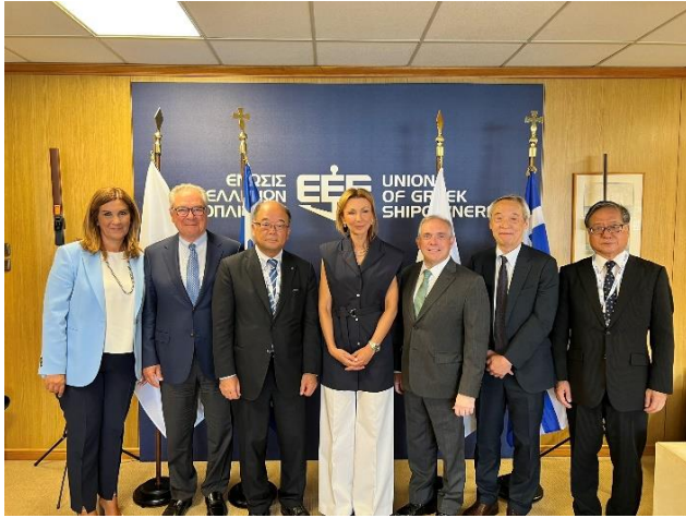
ギリシャ船主連合訪問の様子