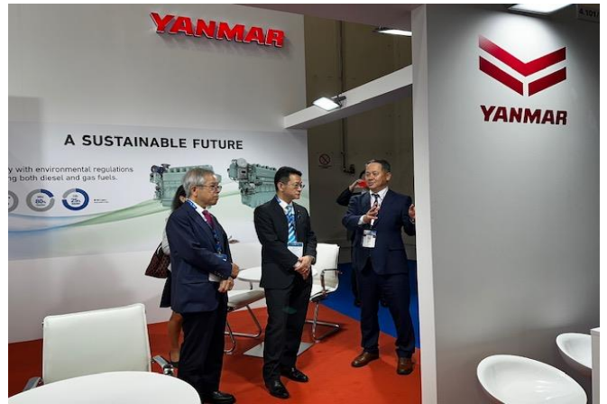
國場副大臣、伊藤大使による巡覧の様子