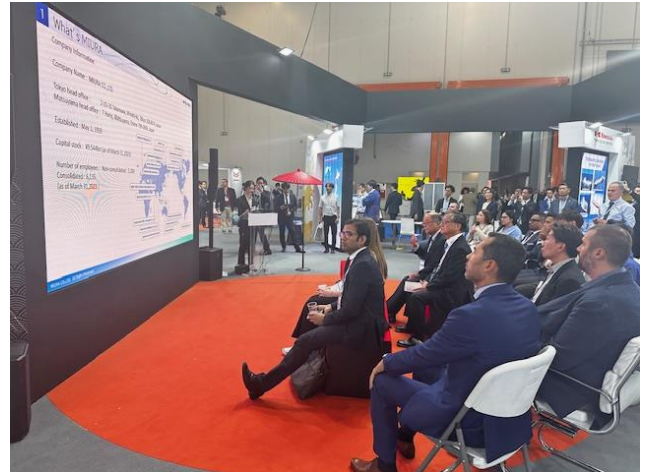
日本パビリオン内プレゼンテーションの様子