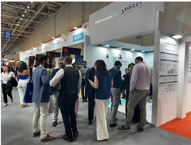
日本パビリオンの様子