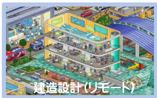
建造設計(リモート)