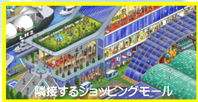
隣接するショッピングモール