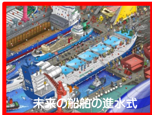
未来の船舶の進水式