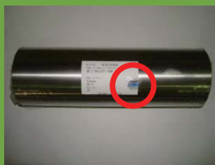
部品本体への貼り付け (ポンプ用スリーブ)