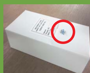
梱包材への貼り付け